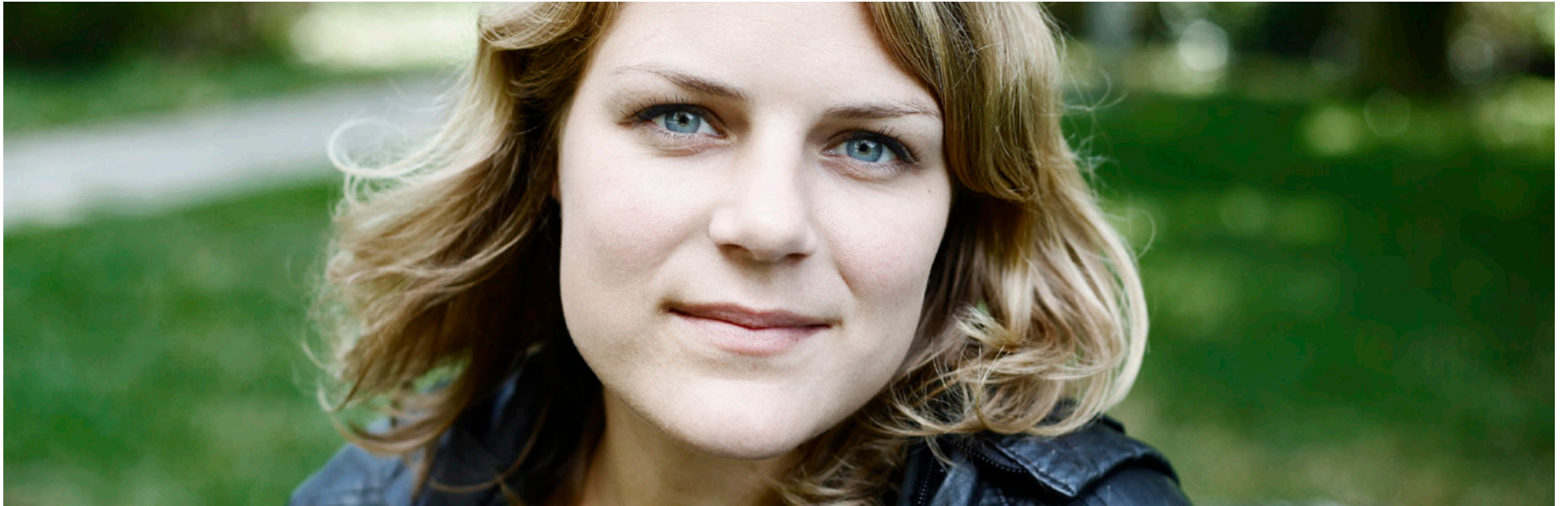
Ung og rød: Johanne Schmidt-Nielsen er Danmarks yngste Folketings-representant.